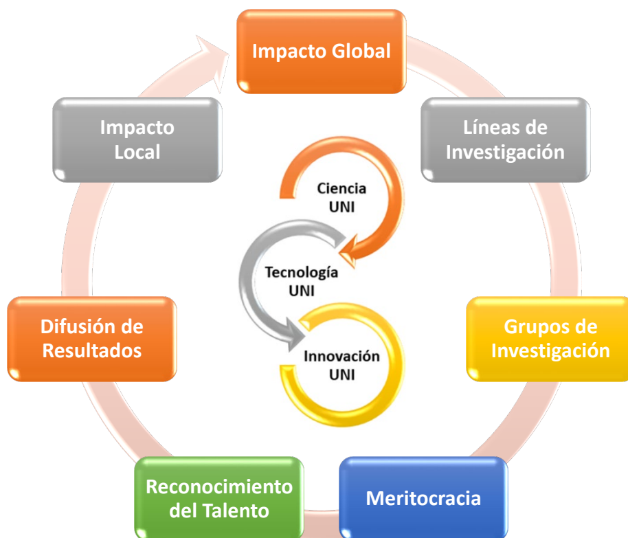
Figura 1. Principios I+D+i de la UNI