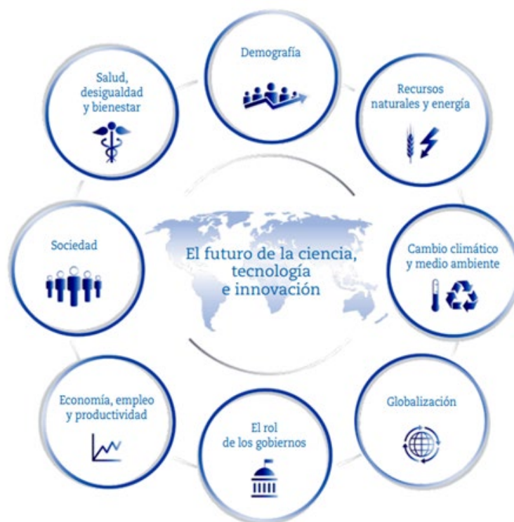
Figura 2. Ocho áreas de megatendencias que impactarán los Sistemas CTI.

En este mundo cambiante, la CTI puede ser una espada de doble filo. Por una parte, los avances tecnológicos tienen el potencial de reforzar los efectos desestabilizadores de muchas de las megatendencias descritas. Por la otra, podrían mejorar la respuesta de la humanidad a muchos de los retos globales que enfrenta el planeta. De cualquier forma, tendrán una gran influencia, a menudo de maneras inesperadas.